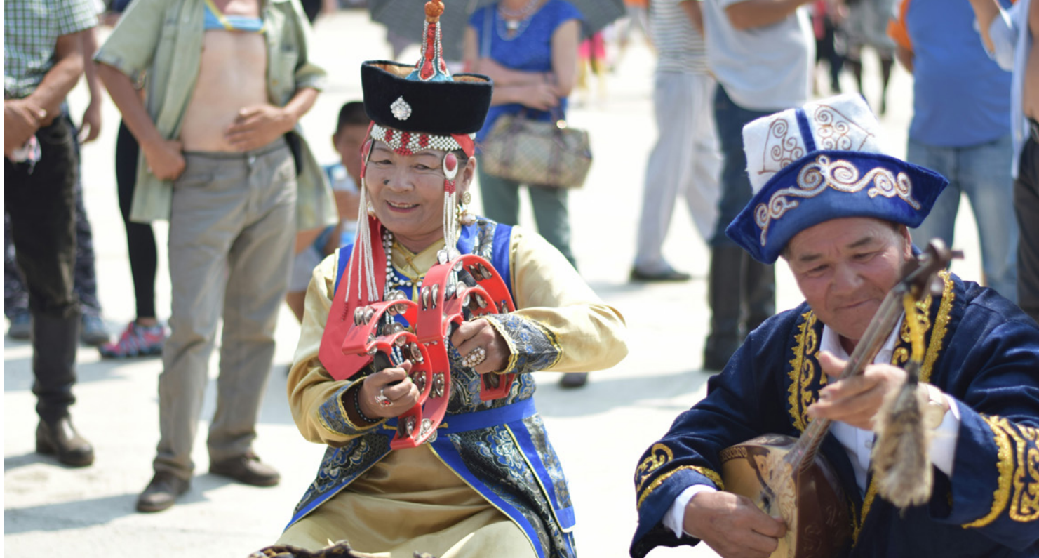
Scène du Naadam, fête nationale célébrée en été dans toute la Mongolie.

19 e siècle, le christianisme a connu un renouveau, principalement grâce à des missionnaires originaires d'Europe et d'Amérique du Nord. En plus de la foi chrétienne, ils ont apporté des connaissances tant médicales que techniques et modernisé l'éducation. Ils ont encouragé non seulement la traduction de la Bible, mais aussi la construction d'écoles et d'imprimeries pour diffuser la littérature chrétienne. Les missionnaires ont trouvé un écho favorable dans de nombreuses régions, ce qui a favorisé la croissance du christianisme dans tout le pays.