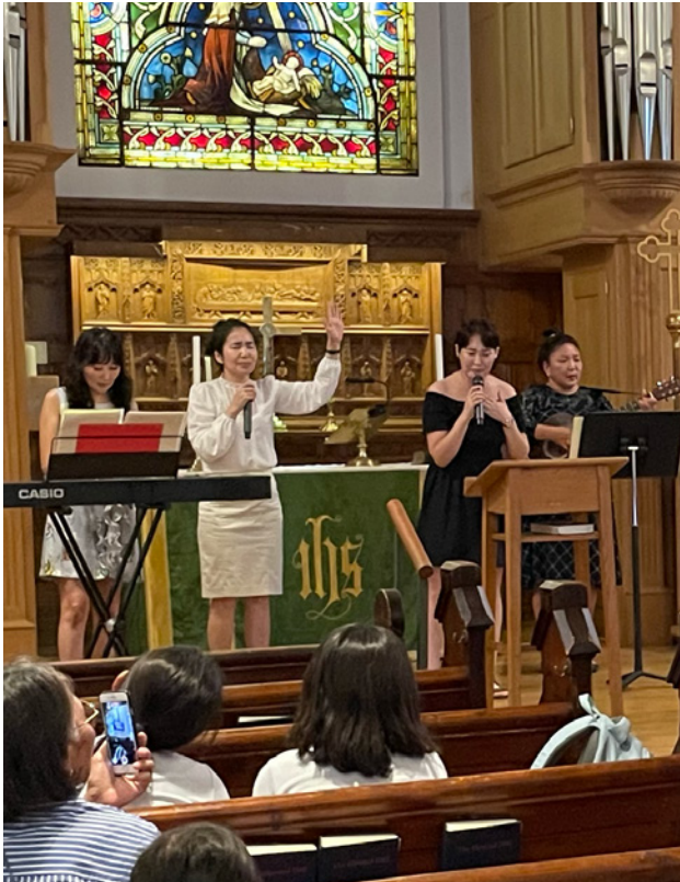
Le groupe de musique de l'Église Living word Geneva .

mais pour exprimer sa gratitude et partager sa vie avec les autres. « Par exemple, lorsque des proches meurent en Mongolie, nous nous réconfortons mutuellement et nous collectons un peu d'argent pour les funérailles. »