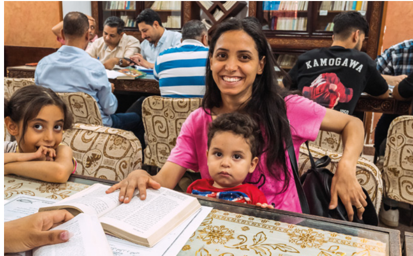
La Société biblique égyptienne encourage les enfants à ouvrir leurs Bibles – et leurs parents s'y mettent aussi.

Depuis qu'elle a pris sa retraite, une villageoise a distribué 6000 bibles à des enfants fréquentant des groupes d'étude biblique. Les petits lecteurs mémorisent des versets et apprennent à mieux connaître la Parole de Dieu et à appliquer les valeurs bibliques dans leur vie.